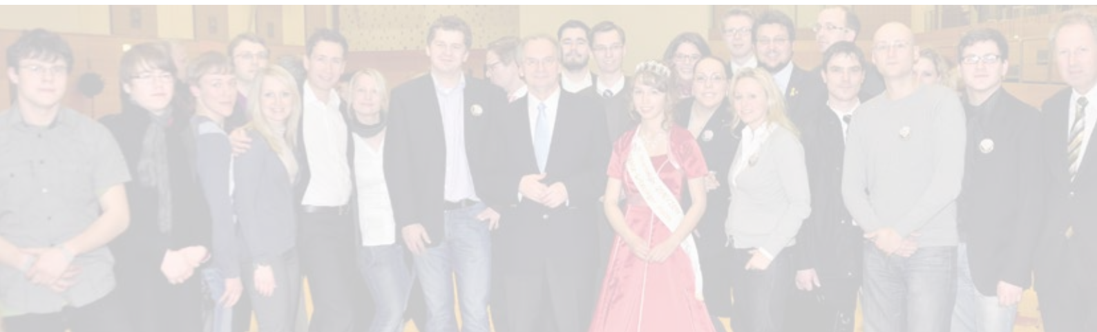
Ministerpräsident Dr. Reiner Haseloff MdL Mitglied im CDU-Bundesvorstand

A handwritten signature in blue ink that reads "Reiner Haseloff".